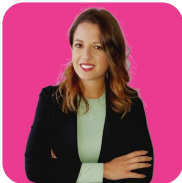
Figure specializzate nella cura delle relazioni tra i caregivers e le famiglie , si occupano di raccogliere le necessità dei dipendenti e gestire a 360° l'esperienza con tutti i servizi.

Il vostro punto di riferimento in Family+Happy