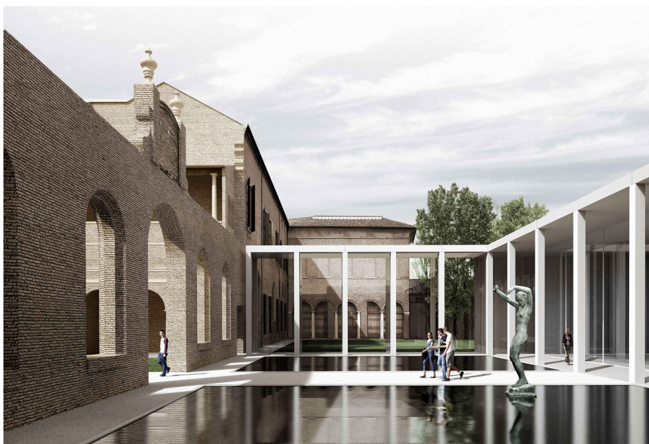
Immagine del Progetto vincitore del Concorso sul Palazzo Diamanti (raggruppamento formato da 3TI progetti, Labics, arch. Elisabetta Fabbri e Vitruvio)

In seguito a Polemiche nate su iniziativa di alcuni Enti e Soggetti che consideravano non corretto il contenuto del Progetto Vincitore e che rischiano di provocare l'annullamento dell'intera procedura si sono sviluppate importanti prese di Posizione ed azioni in difesa e salvaguardia del Concorso, della correttezza della procedura concorsuale e della Validità del Progetto vincitore, espresse fra l'altro dal Cnappc e da molti Ordini Professionale oltre che da Enti di Cultura sui temi dell'Architettura. Importante quanto afferma il CNAPPC che reputa indispensabile " intervenire per tutelare qualcosa di molto più specifico che viene chiamato in causa nel contenzioso tra il comune di Ferrara ed i suoi critici, cioè l'importanza del concorso alla base dell'intero percorso ..... Un concorso trasparente che ha visto coinvolte decine di studi e la stessa cittadinanza non può essere ignorato per ragioni che, alla fine, nulla hanno a che vedere con la sua validità. Va rispettato il percorso concorsuale, vanno rispettati i professionisti coinvolti, va rispettata la progressione temporale che rende insensata una discussione alla fine e non all'inizio del percorso ".